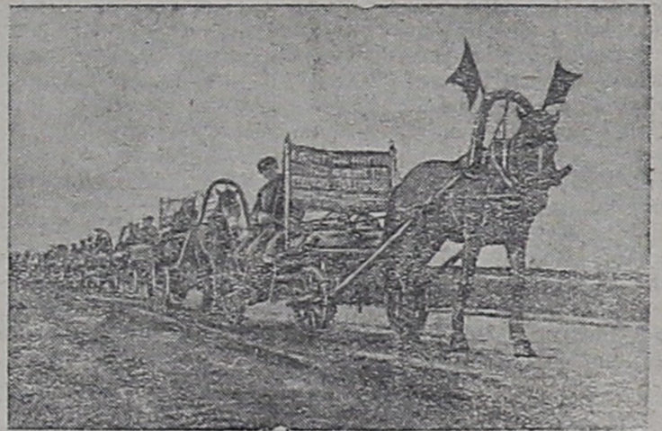
Красный обоз колхоза „Красный партизан“.

В ответ на подлое нападение гитлеровских бандитов, колхозники Петрокаменского района Свердловской области организовали красные обозы. 700 подвод зерна старого урожая досрочно сданы государству в счет хлебопоставок этого года.